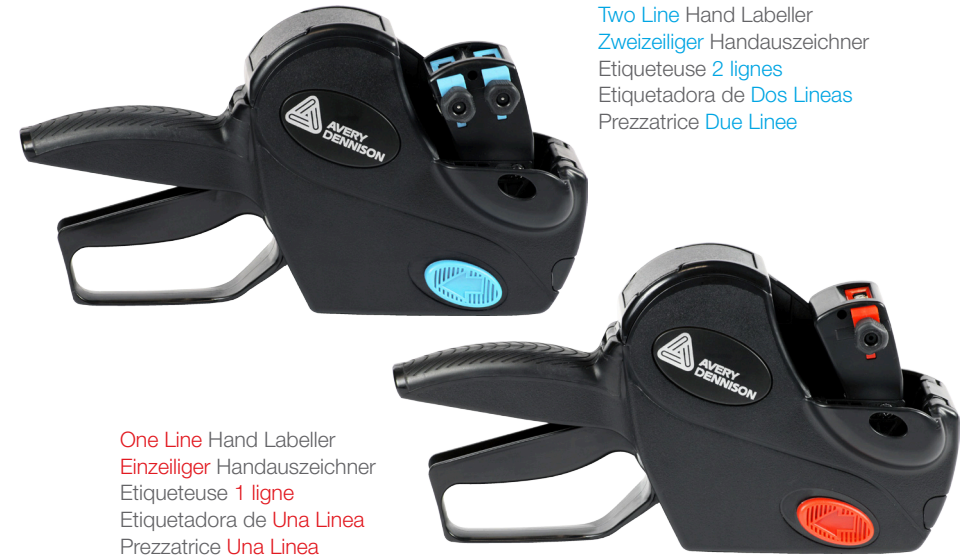
Two Line Hand Labeller Zweizeiliger Handauszeichner Etiqueteuse 2 lignes Etiquetadora de Dos Lineas Prezzatrice Due Linee

4. Locate the screw on the base plate. Slide up or down to adjust the positioning of the print on the label. Die Schraube auf der Bodenplatte nach oben oder unten schieben um bei Bedarf die Position des Drucks auf dem Etikett einzustellen. Repérez la vis sur la plaque inférieure. Faites la glisser à gauche ou à droite pour régler le positionnement d'impression de l'étiquette. Localice el tornillo en la cubierta inferior. Deslice hacia arriba o hacia abajo para ajustar la posición de impresión en la etiqueta. Localizzare la vite nello sportello inferiore. Regolare la posizione di stampa sull'etichetta muovendola avanti o indietro.